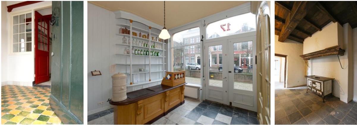
Van links naar rechts: estriken in het Gemeenlandshuis in Maassluis, marmervloer in de Kleine Dijkakker 17 in Bolsward en een vloer van natuursteen in het Kranenbreukershuis te Tegelen.