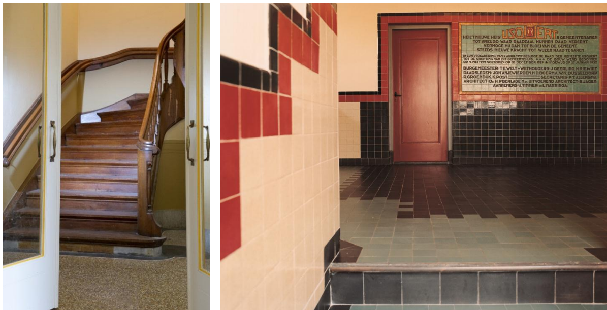
Granito vloer in de entree van de gehoorzaal van het Hodshon Huis, Haarlem, en keramisch tegelwerk in het raadhuis van Berlage in Usquert

Estriken zijn uit klei gebakken, ongeglazuurde vloertegels. Vaak zijn ze roodbruin van kleur, maar ze komen ook voor in geel en groen. Estriken zijn de vroegste vloertegels die in Nederland werden toegepast. Om de tegels waterdicht te maken werden zij oorspronkelijk ingewreven met was. Hierdoor lijkt het bij oude estriken soms alsof zij een glazuurlaag hebben. Later werden estriken wel geglaazuurd. Wanneer vuil zich ophoopt kunt u met een zachte borstel of bezem van natuurlijk materiaal het vuil voorzichtig los borstelen. Pas bij het reinigen van ongeglazuurde tegels goed op: deze tegels zijn poreus waardoor vocht er eenvoudig intrekt. Maak deze tegelvloeren daarom slechts licht vochtig. Ongeglazuurde estriken kunt u verduurzamen met oxaan-olie. Geglaazuurde tegels zijn uiteraard veel beter tegen vocht bestand. Let er wel op dat u gebruik maakt van een zachte dweil om krassen te voorkomen. U kunt tegelvloeren boenen met zachte, niet-ioniserende zeep, zoals groene zeep, babyshampoo of Marseillezeep. Deze laatste reinigt de vloer niet alleen maar laat daarnaast een mooie glans achter. De zeepvlokken lost u op in warm water waarmee u vervolgens de vloer kunt dweilen. Naspoelen met schoon water en de vloer vervolgens laten drogen.