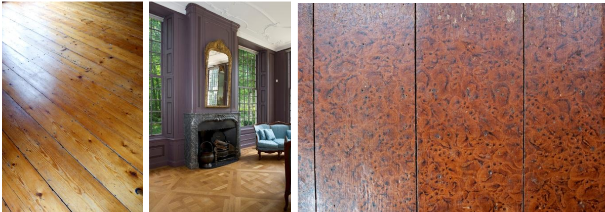
Van links naar rechts: houten vloerdelen in het Hodshon Huis in Haarlem, parket in Sparrendaal te Driebergen-Rijssenburg, en 'voetjesmarmor', met voetafdrukken beschilderde houten delen, in de Oude Delft 49 te Delft.

Wanneer vuil zich ophoopt kunt u met een zachte borstel of bezem van natuurlijk materiaal het vuil voorzichtig los borstelen. Parket- of andere houten vloeren voorzien van een waslaag kunt u met een zachte katoenen doek opwrijven om de waslaag te laten glanzen en stof te verwijderen. Houten vloeren kunnen slecht tegen vocht. Reinig de vloer daarom alleen met water als dat echt noodzakelijk is. Maak de vloer slechts licht vochtig, en let op dat u gebruik maakt van een zachte dweil om krassen te voorkomen. Wanneer u de vloer vochtig reinigt, verwijdert u uiteindelijk de eventueel aanwezige waslaag. De vloer dient dan ook met enige regelmaat opnieuw in de was gezet te worden. Wanneer u water of andere vloeistoffen op een houten vloer morst, maak de vloer dan direct droog met een doek of keukenpapier, zodat de vloeistof niet in het hout kan trekken. Houten vloeren mag u niet zomaar laten opschuren. Hierbij kan namelijk historisch materiaal verloren gaan. Neemt u in dat geval daarom eerst contact op met de Vereniging.